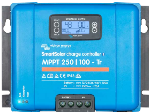
Contrôleur de charge SmartSolar MPPT 250/100-Tr avec un écran enfichable