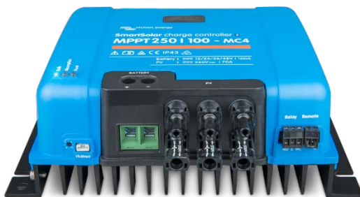
Contrôleur de charge SmartSolar MPPT 250/100 MC4 sans écran