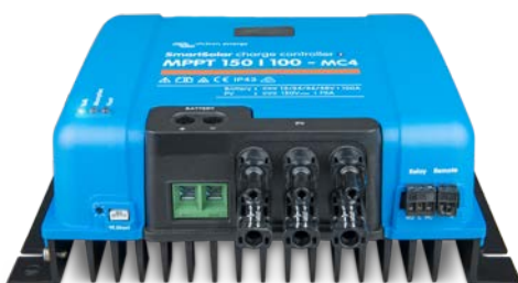
Contrôleur de charge SmartSolar MPPT 150/100 MC4 sans écran