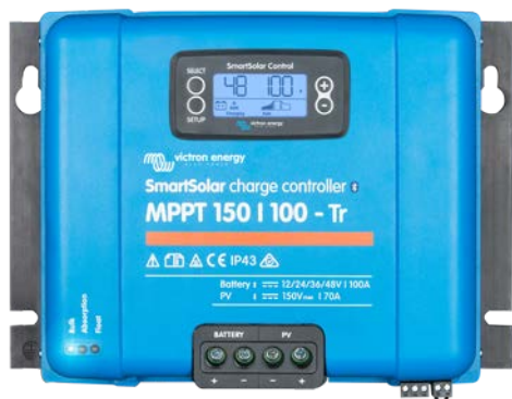
Contrôleur de charge SmartSolar MPPT 150/100-Tr avec un écran enfichable